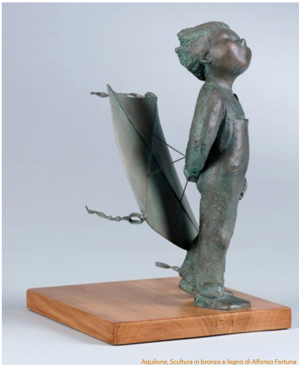
Aquilone, Scultura in bronzo e legno di Alfonso Fortuna